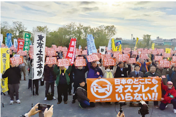
集会では皆でいっせいにプラカードを掲げる

多摩川中央公園にて「横田基地にオスプレイはいらない11・23東京大集会」が開催された。参加者650名との主催者報告