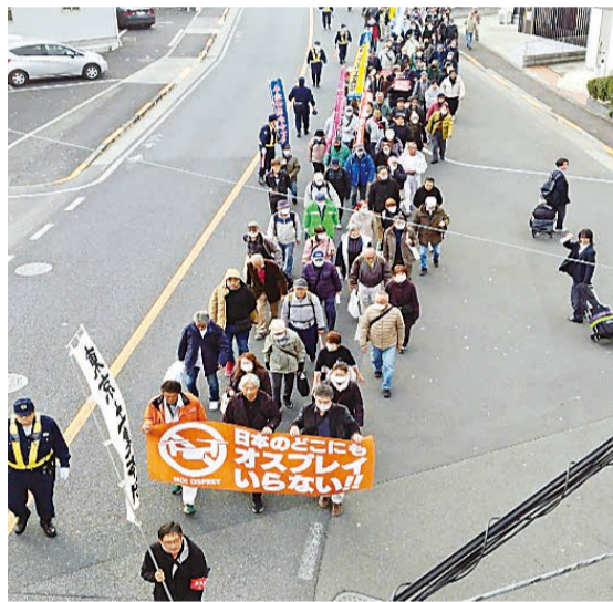
晴天の空の下 多摩川中央公園からパレード

た。各スピーチ内容はオスプレイに対する批判の他、降下訓練中のパラシュートが横田基地場外での落下事故の報告や、PFAS被害のスピーチがクローズアップされた。こうした事実を知り、横田基地のある福生までのア