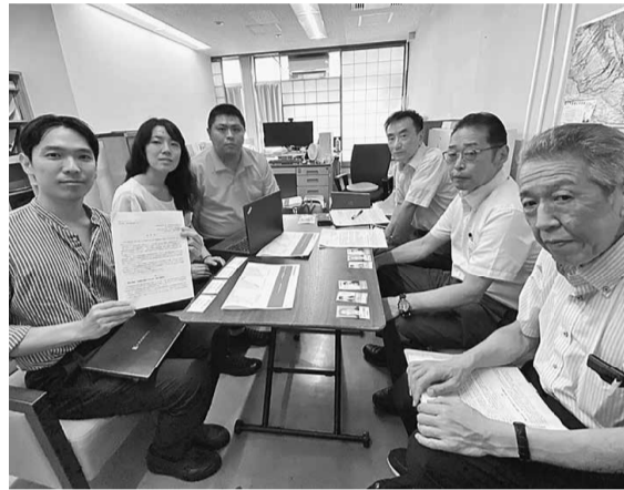
維新の会との懇談 健康保険証の交付復活について理解を求めました

8月19日には自民民主党北区新時代の会と懇談し、公契約条例の認知度の低さや最低報酬下限額を受け取られていない実態を報告し、現場調査