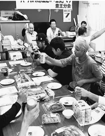
豊王分会の出陣式には 分会内事業所の若手が多く集まりました

重点にします。コロナ禍以降減少した訪問件数を取り戻し、「顔を合わせ言葉で伝える仲間づくり」を実践していきましよう。