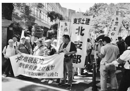
例年開催していた総決起集会と デモはコロナ禍のため 参加ができません

保障拡充の署名や、国保予算要求運動にも取り組んでいます。6月7月の厚労省へのハガキ要請行動への協力ありがとうございませぬ！8月からは東京都への要請行動となります。7月下旬に東京都では副知事依命通達(予算要求の目録)が出され、各局要求に向けての作業が本格化します。これに呼応して、8月9日にかけて、東京都福祉保健局・財務局への要請ハガキに取組み、ハガキ枚数組織人員比40%、シート比100%の達成を目指します。秋の対都交渉では、例年国保課長が仲間からの手紙を読み上げます。仲間の思いの込め