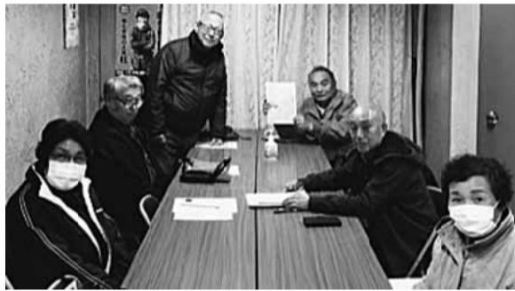
早くも達成の北赤羽分会 加入書を手にとニコリです

から、現場での声掛けを徹底した分会など、幅広い仲間に対する協力要請や未加入者の悩みに応える活動が展開されており、更新や税金申告相