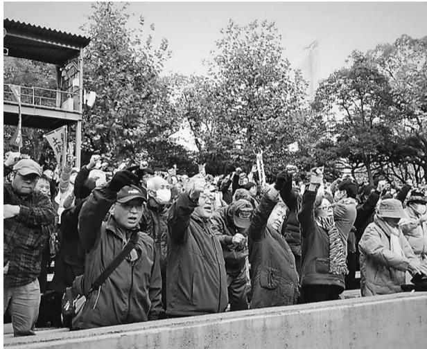
団結で国保予算を勝ち取りましょう！

賃金引き上げと 建設国保の維持発展を 11月20日(水) 開催され北支部から35名(全体で3千名)が参加し、建設国保予算獲得に向けた建設国保予算要求集会在、建設労働者は、