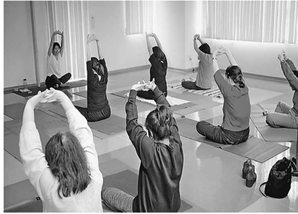
健康づくりのためヨガ教室を開催しました。 伸びる背筋が気持ちいい!

講師も主婦の会から 支部でのヨガで心安らぎ 主婦の会では11月25日(月)北支部会館でヨガ教室を開催しました。 初めての試みでどんなものか興味津々でした。これをキツカケに「明日