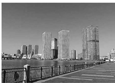
雲一つない ウォーキング日和

め立て地である。今は高層ビルが建ち並び、この湾岸エリアがエキゾチックな風景を醸し出して、デートコースにもふさわしい。心地よい海風を感じながら歩いている。心ならずも、この豊洲は嘗て東京湾の一部で埋