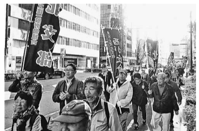
日比谷から デモに出発！

公共工事の設計労務単価はこの7年で5割近くも上昇し、大手ゼネコンや住宅企業は空前の利益をあげて若年入職者不足も