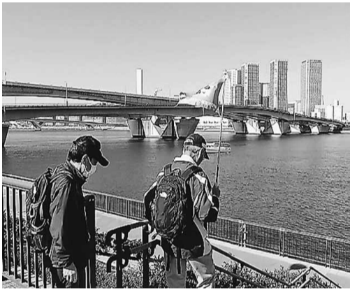
今年のウォーキングは豊洲から バイエリアを歩きます

賃金引き上げと 建設国保の維持発展を 11月20日(水) 開催され北支部から35名(全体で3千名)が参加し、建設国保予算獲得に向けた建設国保予算要求集会在、建設労働者は、