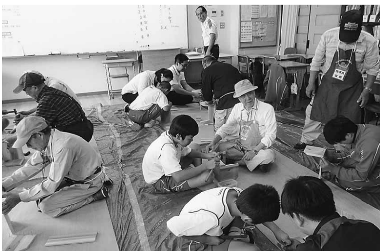
毎年の取組みですが、子供たちの自由な発想には驚かされます

当日は組合よりシニアの会を中心に8名のスタッフ、学校からは30名を超過生徒で木工教室とモザイクタイトル教室に取組みました。木工教室はおなじみの「本立て」をつくり、モザイクタイトルはタイトルの枠にタイトルを自由に貼る創造豊かな工作で、子供たちは大人の発想では絶対に出ない(たとえばタイトルの裏面を貼りつけるなど)自由な発想でタイトルを貼りつけていました。生徒たちは完成したモザイクタイトルや本立てを手に取りみな満足してました。現在の これは組合は未来の大工さん発掘のためと子供たちに木工教室の楽しさを知ってもらい取り組みを続けていきます。