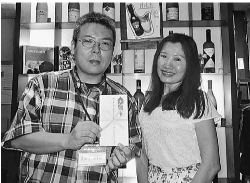
カップル成立! 次のデート用に映画チケットを贈りました

くれたり、2時間の開催ですが、より濃密な楽しい時間となりました。 青年部では、①同じ世代の仲間が集まり②楽しい事を考え③それを形にする!事を大前提にイベントを企画・開催しています。先月の焼肉交流会、そして今回のミュージックナイトを今年度は青年部が開催しました。 何といたっても、青年部の主役は10代20代の仲間です。若い仲間の自