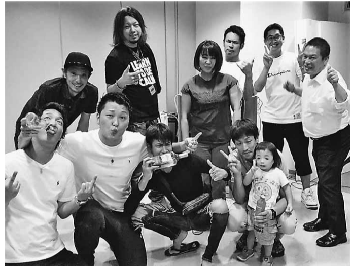
回を追うごとに仲も深まっています!

7月27日(土)北支部青年部が主催する第6回ミュージックナイトを開催しました。当日は台風6号が接近している中での開催でしたが、12名の仲間に参加頂きました。 ミュージックナイトは、ホンモノのDJが音楽を流し、参加者は飲み物・食べ物を食べながら音楽を楽しむというもの!会場作りから運営までイチから手作りで行うイベントです。体を動かしたり、音楽に合わせ