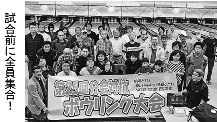
試合前に全員集合!

11月10日(土) 厚生文化部主催の「分会対抗ボウリング大会」が王子サンスクエアにて開催されました。今年46名の参加