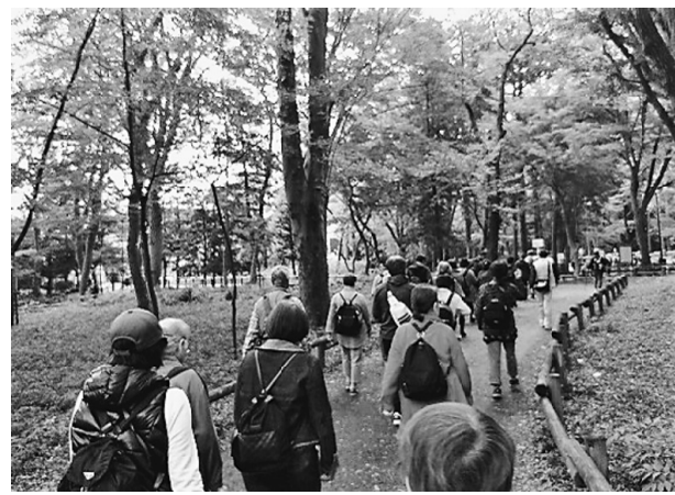
ウォーキングのスタート