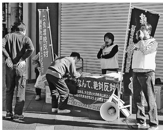
休日の赤羽は人通りも多く 240筆の署名が集まりました!

来年10月からの消費税10%への増税を中止させるため、11月25日(日)11時から赤羽La Lagerで署名宣伝行動に取り組みました。今回の10%増税に伴い5年後からは適格請求書保存方式(インボイス方式)が導入されます。