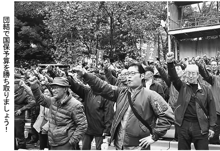
団結で国保予算を勝ち取りましょう!

11月20日(火) 保予算要求集会が賃金・単価引上げ 開催され北支部かと建設国保予算獲得 には40名が参加し得に向けた建設国保 ました。