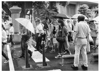
雨の中のデモ行進となりました

7月5日（木）新宿にて次年度土建国保予算満額確保に向けた予算要求集會に北支部から49名が参加しました。