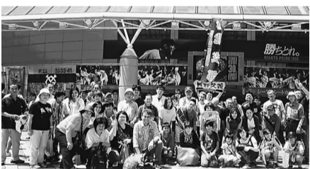
総勢81名！ 全分会から参加です

7月29日（日）東京ドームにて厚生文化部主催のプロ野球観戦ツアー（巨人対中日）を実施しました。総勢39グループ81人、2年連続分科会から参加での開催となりました。