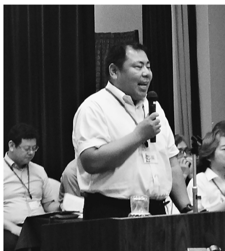
分会活動の活性化と 後継者世代が定着できる組合活動について 本部石川後継者対策部長

今回で6年目となる「本部・分会経験交流集会」が7月7日から8日にかけて、群馬県・磯部ガーデンホテルで開催されました。全体で247名、北支部からは8名が参加、「群・分会の活性」「後継者育成」「未結集事業所との関係強化」という3つの組織課題を前進させるため、各支部の経験と教訓を交流しました。支部からの