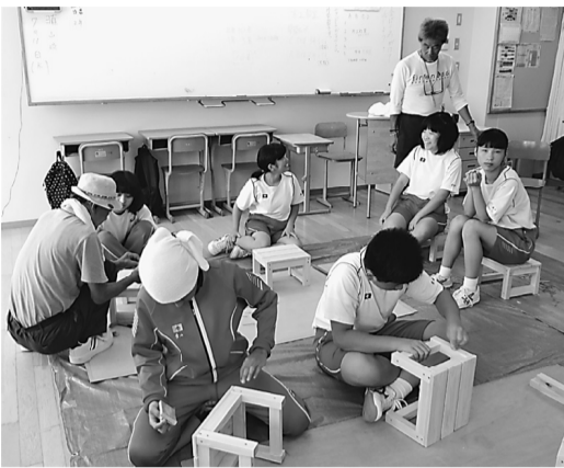
自分で作った踏み台に試し座り けっこう安定感あります!

7月11日(水) 北区立明桜中学校にて毎年恒例の木工教室が取り組まれました。当日は生徒44名に対し、土建シニアの会より6名の組合員が「実技の講師」として参加しました。木工教室では1番人気である「踏み台」を生徒全員で作りました。余った時間で、生徒からは「釘を打つても入っていかぬ」「釘をまっすぐに打つのが難しい」などの声が多く聞かれました。今の子供たちは授業で木工細工をしたことがない子供ばかりですが、四苦八苦して「踏み台」を完成させました。余った時間で、生徒からは「踏み台の材料はなにかな」「大工仕事では何が大変かな」などたくさん質問がありました。