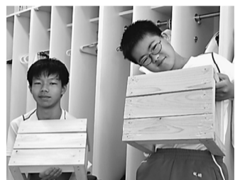
うまく作れましたとニコリ

7月11日(水) 北区立明桜中学校にて毎年恒例の木工教室が取り組まれました。当日は生徒44名に対し、土建シニアの会より6名の組合員が「実技の講師」として参加しました。木工教室では1番人気である「踏み台」を生徒全員で作りました。余った時間で、生徒からは「釘を打つても入っていかぬ」「釘をまっすぐに打つのが難しい」などの声が多く聞かれました。今の子供たちは授業で木工細工をしたことがない子供ばかりですが、四苦八苦して「踏み台」を完成させました。余った時間で、生徒からは「踏み台の材料はなにかな」「大工仕事では何が大変かな」などたくさん質問がありました。