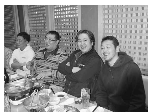
若手もたくさん集まりました!

滝野川分会 1月27日(土) 19時から巣鴨の泰平飯店で、滝野川分会の新年会を開催しました。分会長のあいさつ後、気の合う仲間達と中華を堪能