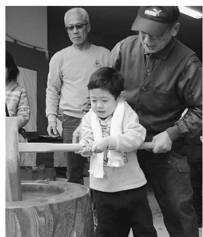
はじめての餅つきにどきどき！