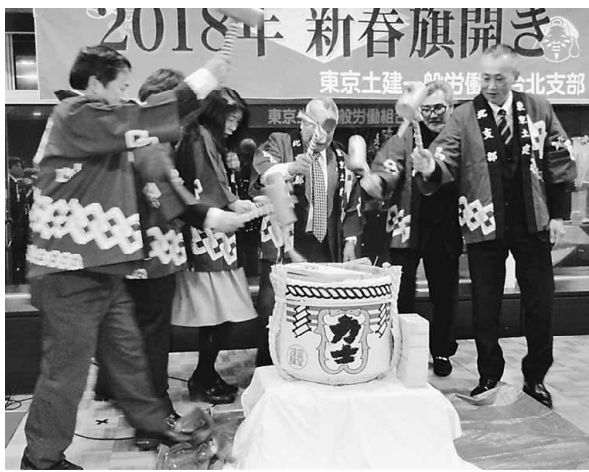
新年を祝って鏡開き！

1月18日(木) 19時半から2018年北支部旗開きを開催しました。今年は北とびあペガサスホールに会場を変更し、多