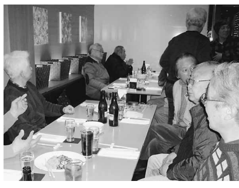
昔からの仲間も集まり 楽しく交流しました!

滝野川分会 1月27日(土) 19時から巣鴨の泰平飯店で、滝野川分会の新年会を開催しました。分会長のあいさつ後、気の合う仲間達と中華を堪能