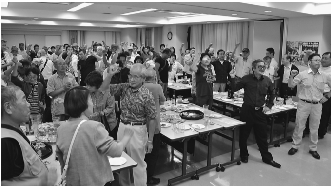
9月3日には支部活動者会議・拡大決起集会在 行なわれました

秋の仲間づくり 月間が9月からい よいよ始まりまし た。 北支部ではこの 間、拡大運動の土 台となる分会活動 を軸とした組織強 化活動を意識的に 進めてきました。 また、10月から