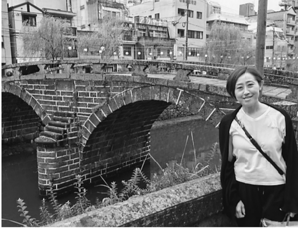
眼鏡橋での記念撮影

私は8月7日から9日長崎の原水禁世界大会に参加させていただきました。当日7日は台風の影響もあまりなく無事に長崎の世界大会会場に到着できました。