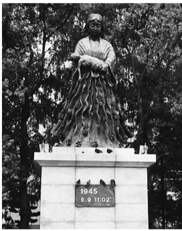
公園内にある母子像と原爆の投下された日時