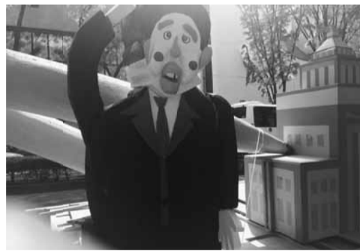
「あの人」そっくりですね