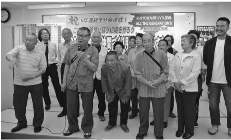
会心の成果に笑顔がこぼれる十中央分会

春の仲間づくり運動は、6年連続で全分会が目標達成しました。事業所関連の加入が相次ぎ、大幅な目標超過となりました。 目標96人に対し、成果は131人。何と35人も超過で春の月間は大成功のうちを終了しました。特に赤羽分会と十中央分会においては2けたの超過という目覚ましい成果を達成しました。 今回の春の拡大で特徴的だったことは、先の2分会で事業所の加入が相次いだことです。この間ずっと呼びかけてきた社会保険問題での加入をはじめ、外注の下職さんをまとめて一人親方労災に加入させるなどのケースがありました。また、恒例の日曜行動では、神東分会が90人超、十中央分会が70人超の仲間をバ だし、これは決して「棚ぼた」ではありません。通常、厚生年金とセットである協会けんぽではなく、東京土建国保に特例的に加入できるようにしたのは過去の運動の成果であり、また、数ある労働保険事務組合の中から土建が選ばれたのは、組合員の立場に立った労災手続きが決め手となったからです。事業所の要求と組合の運動が合致した結果です。