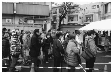
▲王子税務署で集団申告