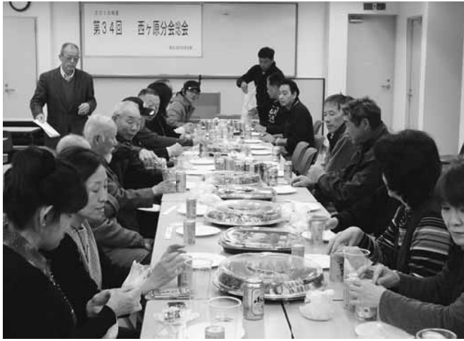
総会の後は楽しく懇親会