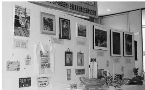
▲にぎやかなギャラリーが出来ました