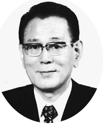
北区長 花川興惣様