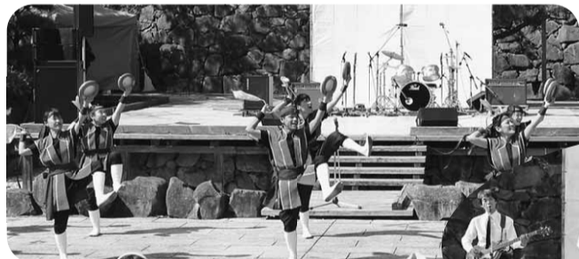
華やかなステージ