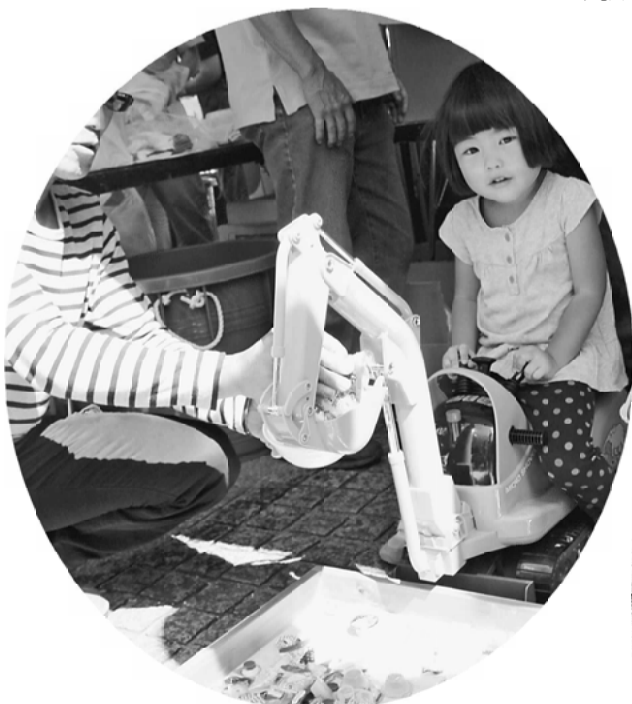
ショベルカーお菓子すくい