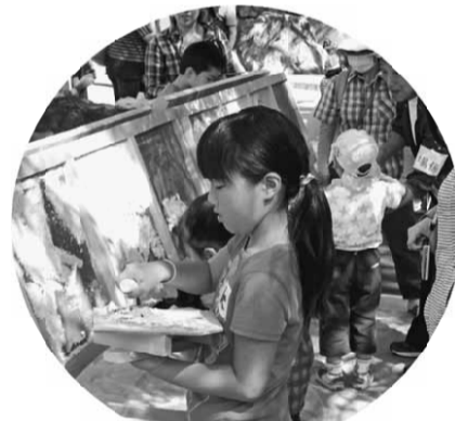
左官体験コーナー