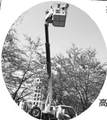
高所作業車コーナー

今回の秋の大住宅デーでは、高所作業車に乗ってみようという子供用ショベルカーのお菓子すくいも、その反面で担当者として反省点もありました。その点についてまとめました。住宅デーのポストカードのデザインも、暖味で混乱があった。ステージの時間が押ししまつた。などありました。