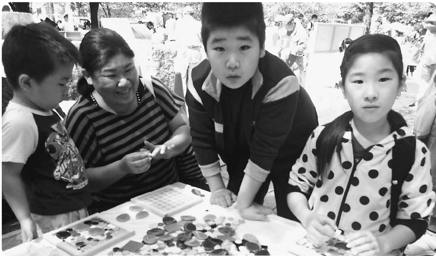
いろんな石があって、迷っちゃうね モザイクタイル

秋の大住宅デーが9月28日(日)飛鳥山公園にて開催されました。各分会や青年部、北PAL、主婦の会のブースの模擬店も閉会前には完売となり、また後継者対策部による高所作業車乗り、子供用ショベルカーでのお菓子すくい、迫力満点のステージ、起震車体験など盛り沢山の催しで大盛況となりました。子供木工作コーナーも順番待ちの長蛇の列が出来ていたり、会場からは来場した子供達の楽しそうな歓声に溢れていました。そして分会を超えて組合員さん同士の交流も盛んに行われていました。 この日の来場者は15000人となりました。