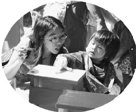
塗装体験コーナー