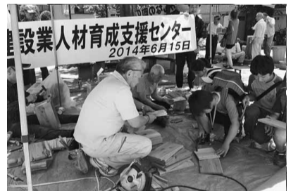
八幡通り児童遊園 滝野川分会