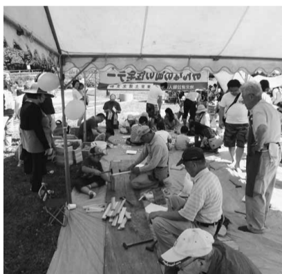
清水坂公園 十央分会