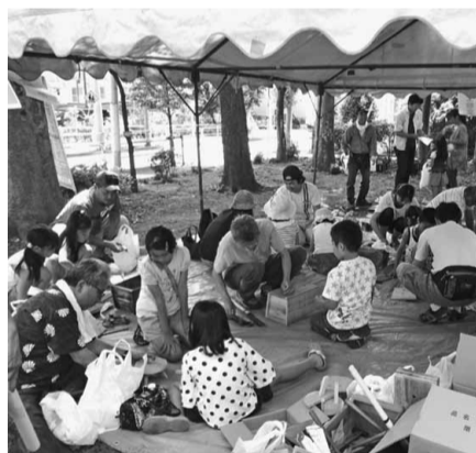
区立北運動公園 神東分会