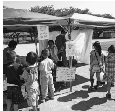
桐ヶ丘郷小学校 西が丘分会

模擬店など、各分会で来場者が楽しめる工夫を凝らした住宅デーとなりました。当日の全体的な総括は今後のために準備段階で