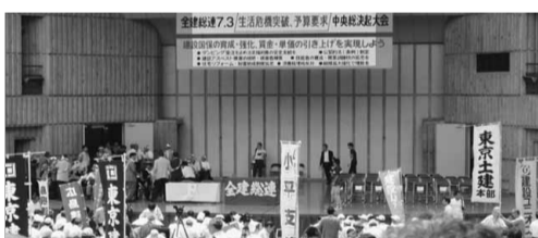
昨年の中央決起集会の様子

各年金事務所から、厚生年金加入している事業所に平成26年の算定基礎届の書類が届く頃となりました。東京土建北支部では、7月8日(火)から10日(木)の13時半から16時までの間、「算定基礎届記入会」を開催します。 算定基礎届の記入の仕方が分からない、年金事務所へ申請に行く時間がない、年金事務所との個別調査対象となつてしまったなど、お困りの事業主の方がいらつしやいましたら、ぜひご参加ください。但し、個別調査対象の方は、事前に支部までFAX下さい。 ①年金事務所から届いた算定基礎届の書類一式 ②社判・代表者印 ③貸金台帳・源泉税領収証コピー ④年会費4人まで一万2千円、4人以上1万8千円 また厚生年金加入の上、土建の国民健康保険証をお持ちの組合員の方は、必ず算定基礎届の提出をして、年金事務所から戻る「標準報酬決定通知書」を支部までFAX下さい。