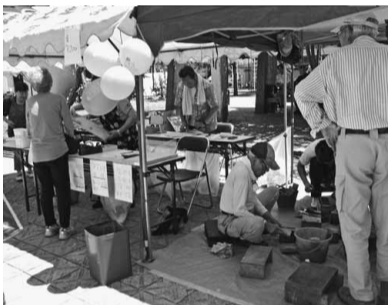
赤羽公園 赤羽分会