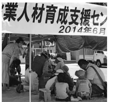
西中里公園 西ヶ原分会