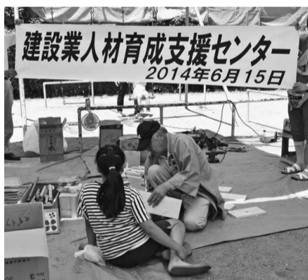
豊島7丁目南児童遊園 豊王分会