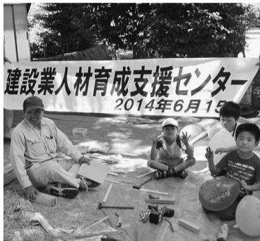
赤羽台3丁目公園 北赤羽分会