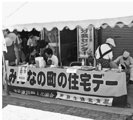
梶原商店街 北東分会