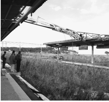
被災した当時のままのこされた富岡駅

発行所 東京土建一般労働組合 城北ブロック会議 東京都豊島区西池袋5-22-15 板橋 (3963) 5 3 2 5 練馬 (3825) 5 5 2 2 豊島 (3986) 2 4 7 1 ※北 (5390) 6 0 2 1 発行人代表者 佐藤広平 発行日 1日、9日、17日、25日