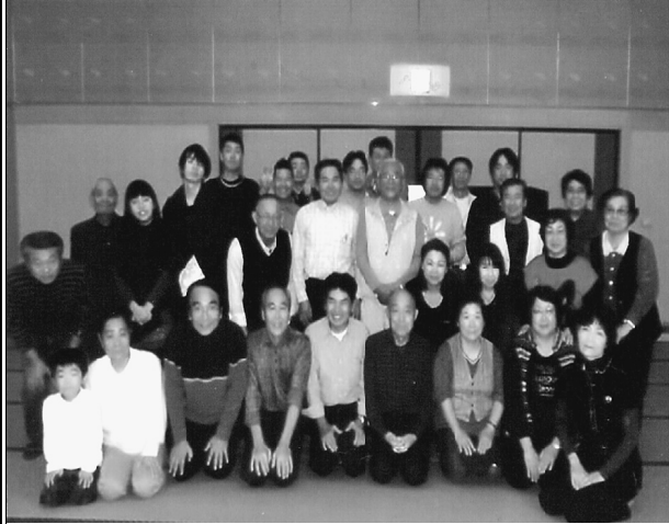
参加された北赤羽分会の皆さん