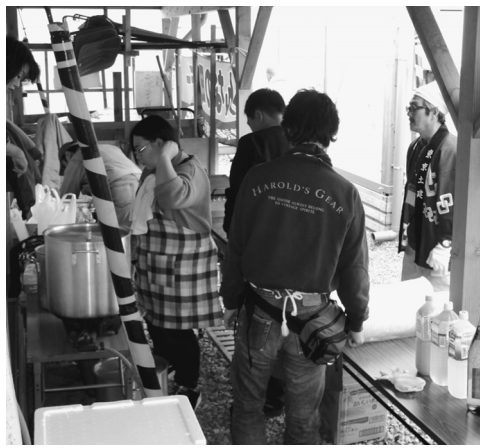
住宅デー炊き出しの様子

初日は未だ残る地震と津波の被害を目の当たりにして参加者からは悲しい驚きしか出ませんでした。榎葉町にある宝鏡寺では、未だに身元不明の遺骨が6人分安置され、家族・親類を待ちわびているようでした。