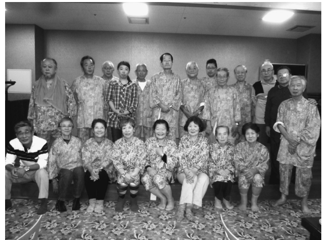
参加された赤羽分会の皆さん

10月20日(日)朝から雨降りの中、バスで草津温泉センターへ向かいました。参加した人数が少なかったが、車中では楽しいおしゃべりで盛り上がり、お昼頃に草津温泉センターに到着しました。温泉センターでは、美味しい食事を食べながら、お酒を頂き、昔の唄を歌ったり、踊ったりと赤羽分会交流の一時を過ごしました。その後には温泉のお風呂で日頃の疲れを取り、のんびりとした時間となりました。楽しい時間は瞬く間に過ぎ