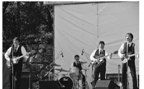
いつも大人気！ノーザンソングス