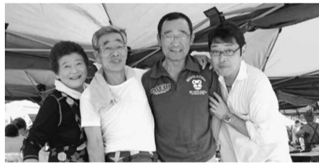
赤羽分会ブースの皆さん

10月27日(日) 滝野川分会のバーベキュー大会は、お天気に恵まれ、多くのお客様がご参加くださいました。お天気に恵まれ、多くのお客様がご参加くださいました。