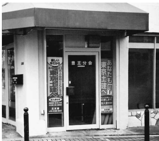
新しい豊王分会センターです。

どけん共済会の「秋の拡大月間」は、11月まで継続中です。「火災共済」は、火災だけではなく自然災害(台風、竜巻、落雷など)による家屋破壊や泥棒などによる家屋破壊も保障の対象となります。また自転車保険は自転車事故だけでなく、日常生活内の不慮の事故による物品破壊やペットによる人身傷害の給付も対象となる「日常生活賠償責任補償」も付いています。(例えば、洗濯ホース排水による階下の家財品弁償、旅行中に誤って落として破損させたビデオカメラ等)自動車共済については、現在の保険と比較するための見積りをお願いします。