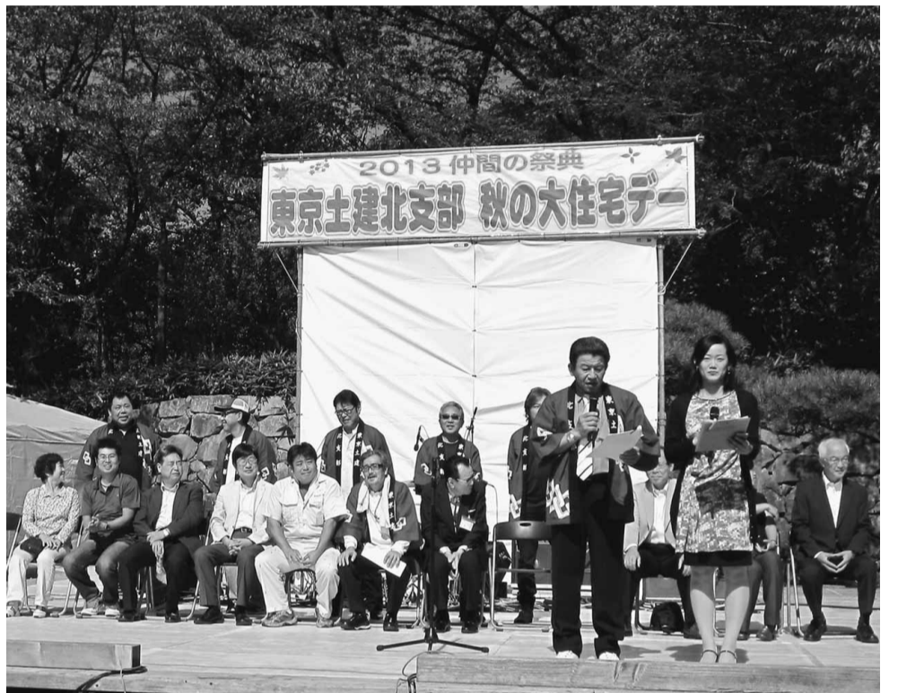
「第36回 秋の大住宅デーの始まりです」