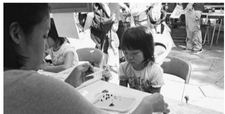
ビーズアクセサリー 西が丘分会ブース