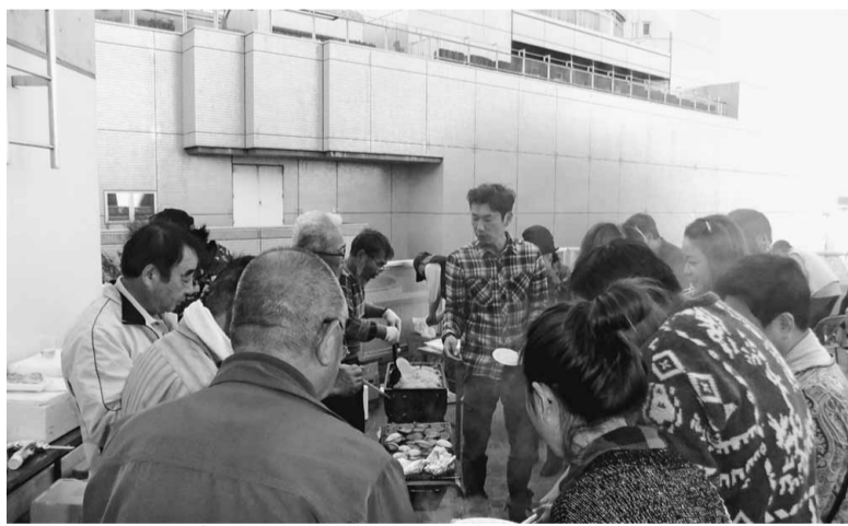
青空の下、おいしいお肉を沢山食べました。

10月27日(日) 滝野川分会のバーベキュー大会は、お天気に恵まれ、多くのお客様がご参加くださいました。お天気に恵まれ、多くのお客様がご参加くださいました。