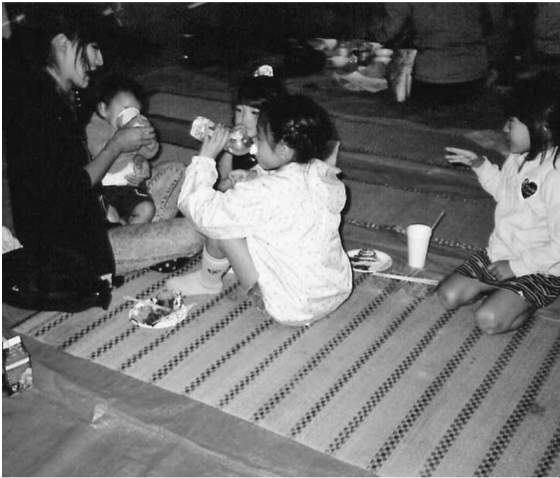
大人も子供も、美味しいバーベキューに満足

雨の日に開催された豊王分会のバーベキュー大会は、お天気に恵まれ、多くのお客様がご参加くださいました。お天気に恵まれ、多くのお客様がご参加くださいました。お天気に恵まれ、多くのお客様がご参加くださいました。