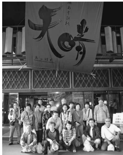
伊香保温泉ホテル「天坊」の前で

10月6日(日)朝7時半にバスに乗り込み、まずは「聖酒造」向かい、酒造り見学をしました。その後バスは今回のメインイベントである伊香保のホテル「天坊」のホールへ。こちらは、宴会場での食べられないほどのご馳走を頂き、お腹を満たした後は温泉を楽しんだり、おしゃべりをした り、散策をしたりと、それぞれの思い思いに楽しい時間を過ごしました。お腹も気持ちも満たした後は水沢観音を観光し、舞茸センターで買い物を楽しんだ後、帰路に着きました。今回の分レク参加は大人21人でした。 神東分会 小沼 正和