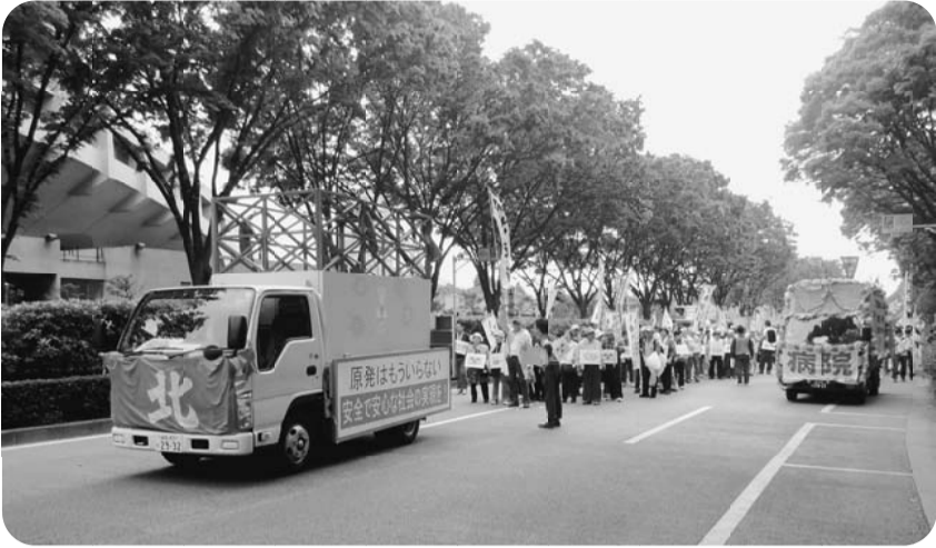
出発時に少し雨になりましたが、宣伝カーを先頭にアピール行進

5月1日(火)第83回中央メーデーが代々木公園にて開催され、「消費税増税・TPP参加反対」「住民本位の震災復興」「原発なくそう」「雇用と仕事の確保」など各団体横断幕やプラカードを持ち寄ってアピールしていました。参加者21000人(北支部