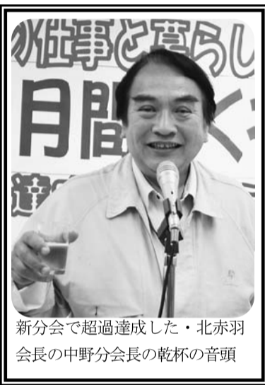
新分会で超過達成した・北赤羽会長の中野分会長の乾杯の音頭

分会の活動家の皆さんが、積極的にチラシのポスティング、組合員訪問に取り組みで頂き大きく行動範囲が増えてきています。このような経験は、今年危惧しているゴールデンウィーク明けの後退は在ったものの、その後各分会成果を獲得